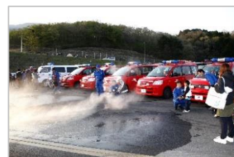
キッズ専用 SF スペシャル体験走行 コース上での消火体験

ご家族・グループの皆様を愛車に乗せ、決勝レースの熱気が残るレーシングコースをオフィシャルカー先導で走行いただけます。今回もスターティンググリッド上での記念撮影や、プロカメラマンが撮影した愛車の走行シーンを写真購入サイトでダウンロードできるほか、 第1戦の開催日8日(土)は、15歳以下のお子様1名以上お連れで来場されたお客様30台限定の「キッズ専用」とし、体験走行と記念撮影に加え、消火専用車の消防機材、グラベル耕し、ポストでの旗振り、コース清掃などレースオフィシャルのお仕事を体験いただけます。