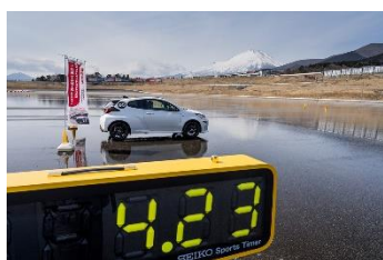
タイムトライアル