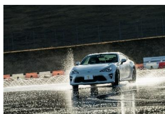
86 走行データ計測 体験プログラム

詳細は、公式サイト( https://www.fsw.tv/motorsports/racing/2023sf12/index.html )をご参照下さい。 皆様のご来場をお待ちしています。