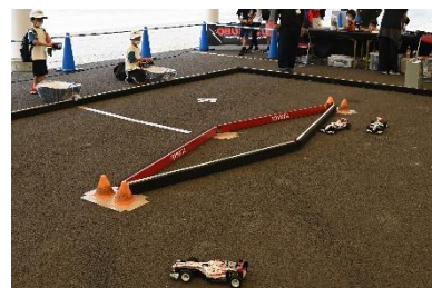
トヨタ RC カーチャレンジ

スーパーフォーミュラ(SF)に参戦するチームがブースを出展。『JRP x ホンダ x トヨタ合同ブース』では、ドライバー関連グッズやパネル展示をご覧いただけます。また、キッズカートやトヨタ RC カーチャレンジのほか、ピット作業に挑戦できる「ピットクルーチャレンジ」など、お子様から大人で楽しめるコンテンツが満載です。