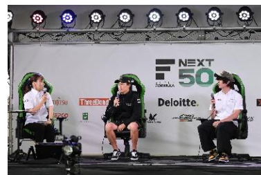
ドライバートークショー

レーシングドライバーやチーム監督が出演し、レース直前のコメントが聞けるほか、第1戦・第2戦の各決勝レース後に表彰台に上がったトップ3選手のドライバートークショーを両日行います。