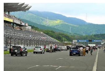
SF スペシャル体験走行 スターティンググリッド上での 記念撮影

参加料(税込): 1台 5,000円(当日申込) 受付: 場内イベント広場 チケットカウンター 写真購入サイト: URL: http://allsports.jp/event/01184778.html