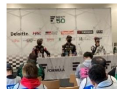
モータージャーナリスト