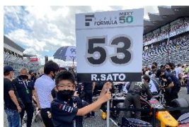
グリッドボードスタッフ