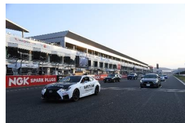
スペシャル体験走行