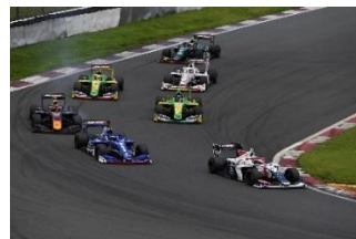
※写真は昨年大会のもの。