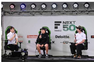
ドライバートークショー