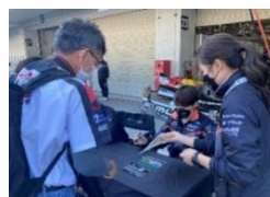
チームマネージャー