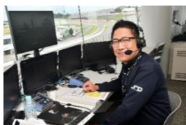
場内アナウンサー