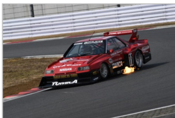
ツーリングカーデモラン

走行コンテンツの最後には、レジェンドドライバーと現役のレーシングドライバー或いは監督によるチーム対抗の「FISCOレジェンドカップ」を行い、SUPER GTでチャンピオンを獲得した経験を持つ平手晃平選手、松田次生選手、ロニー・クインタレッリ選手、ARTAのエグゼクティブ・アドバイザー土屋圭市氏など、8組16名のドライバーが参戦し、来場のお客様より多くの声援を受けていました。