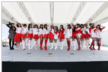
クレインズ大同窓会

パドックに設けたステージでは、AKB48 Team 8によるスペシャルライブ、レジェンドドライバーによるトークステージ、歴代のFSWイメージガールが出演した「クレインズ大同窓会」などを実施、お子様から大人までお楽しみいただきました。