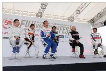
レジェンドドライバー トークショー