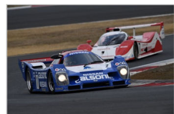
Nostalgic Group C Special Run