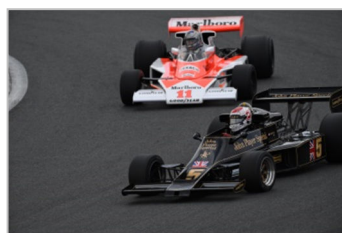
Back to F1 WORLD CHAMPIONSHIP IN JAPAN