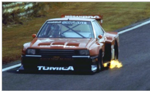
展示車両 スカイライン スーパーシルエット

物販コーナーでは、50周年記念グッズ、ミニカーの他、2017年オリジナル卓上カレンダーを1冊540円(税込)、FUJI WONDERLAND FES!のCパドック指定駐車券(税込5,400円、東京オートサロン会場限定販売、卓上カレンダー付き)を販売します。