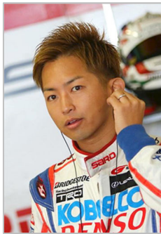
2016年 SUPER GT チャンピオンドライバー 平手晃平選手

富士スピードウェイのチェカドライバー「チャカレンジャー」によるトークショーです。2016年 SUPER GT のシリーズチャンピオンに輝いた平手晃平選手や、松田次生選手、ロニー・クインタレッリ選手による富士スピードウェイ名物のトークショーを東京オートサロンで実施します。2011年から昨年までの過去6年、SUPER GT チャンピオンは、3人の「チェカレンジャー」のいずれかが獲得しています！今回も、レースでの本音や今シーズンの抱負など、富士スピードウェイブースでのトークショーだから聞ける楽しい話題が一杯です。