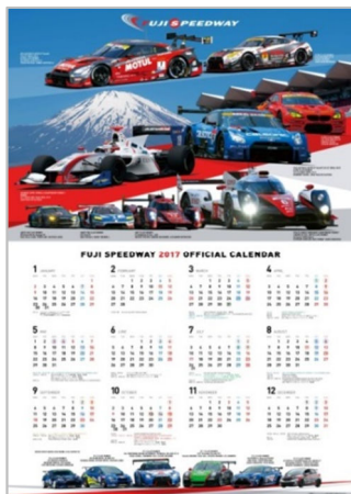
富士スピードウェイ オリジナルポスターカレンダー

さらに、大会期間中、FSW公式Facebookに「いいね」をいただいた方に、当社オリジナルポスターカレンダー(数量限定)をプレゼントさせていただきます。