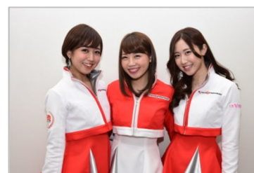
富士スピードウェイイメージガール 「クレインズ」