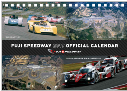
オリジナル卓上カレンダー 価格 540円(税込)

また、 FIA 世界耐久選手権 富士6時間耐久レース(WEC 富士) コーナーでは、WECに参戦したレーシングカーのミニカー展示(協力:Spark Japan)やレース映像の放映により、サーキットの臨場感を再現するなど、富士スピードウェイの魅力が満載です。