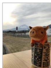
FSW グッズ 「富士のうり坊」 「湯呑み」