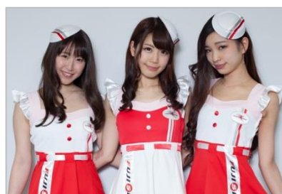
富士スピードウェイイメージガール 「クレインズ」