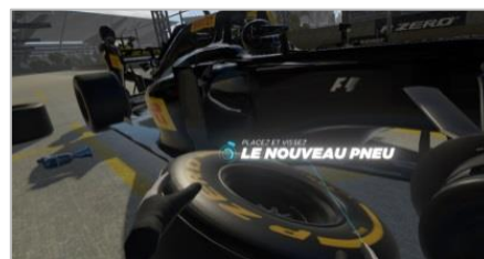
VR Pit Work