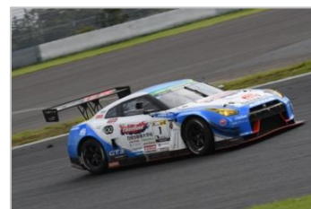
展示車両 スリーポンド 日産自動車大学校 GT-R